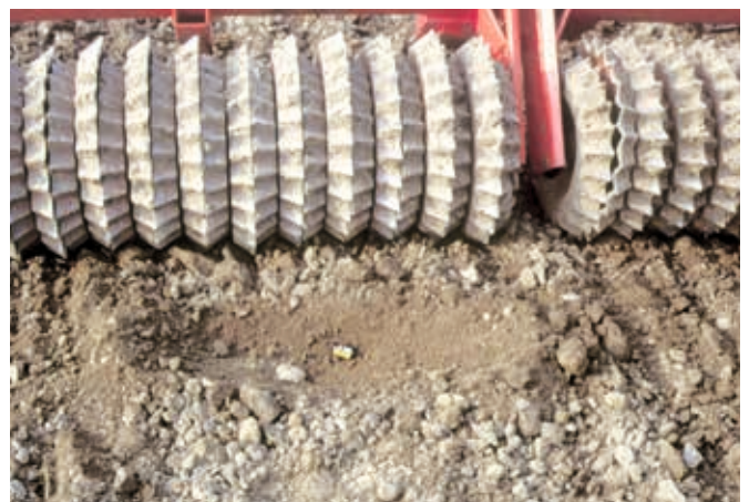
Grobkrümel oben, garantieren besten Verschlämmungsschutz. Feinerde im festen, wasserführenden Saathorizont! GÜTTLER Walzen hinterlassen ein ideales Saatbett.