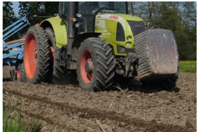
Schlepper mit Frontgewicht – So vergeudet man Energie, schädigt den Boden und die Kultur