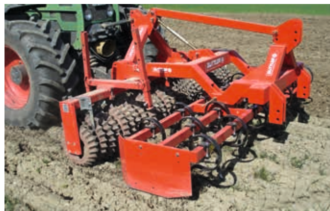
Matador 30 – Mit Zinkenvorsatz und Heck-Dreipunkturm (Zubehör)