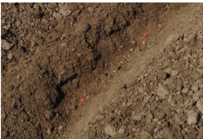
Feinerde unten bewirkt beste Sameneinbettung