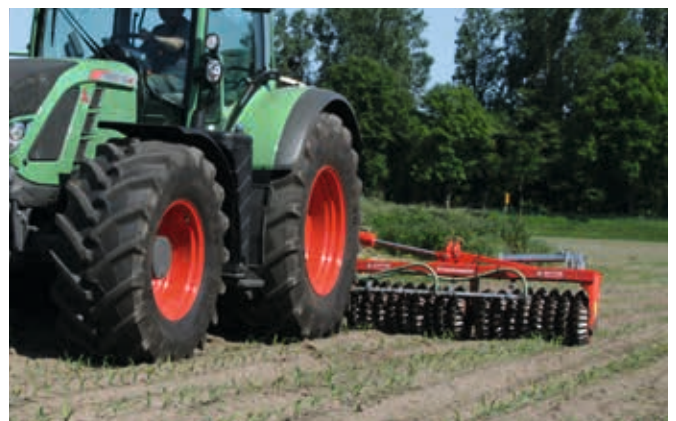
Matador 610 – Untersaaten in Mais (oder Getreide) einbringen – Zwischenfruchtanbau etc.