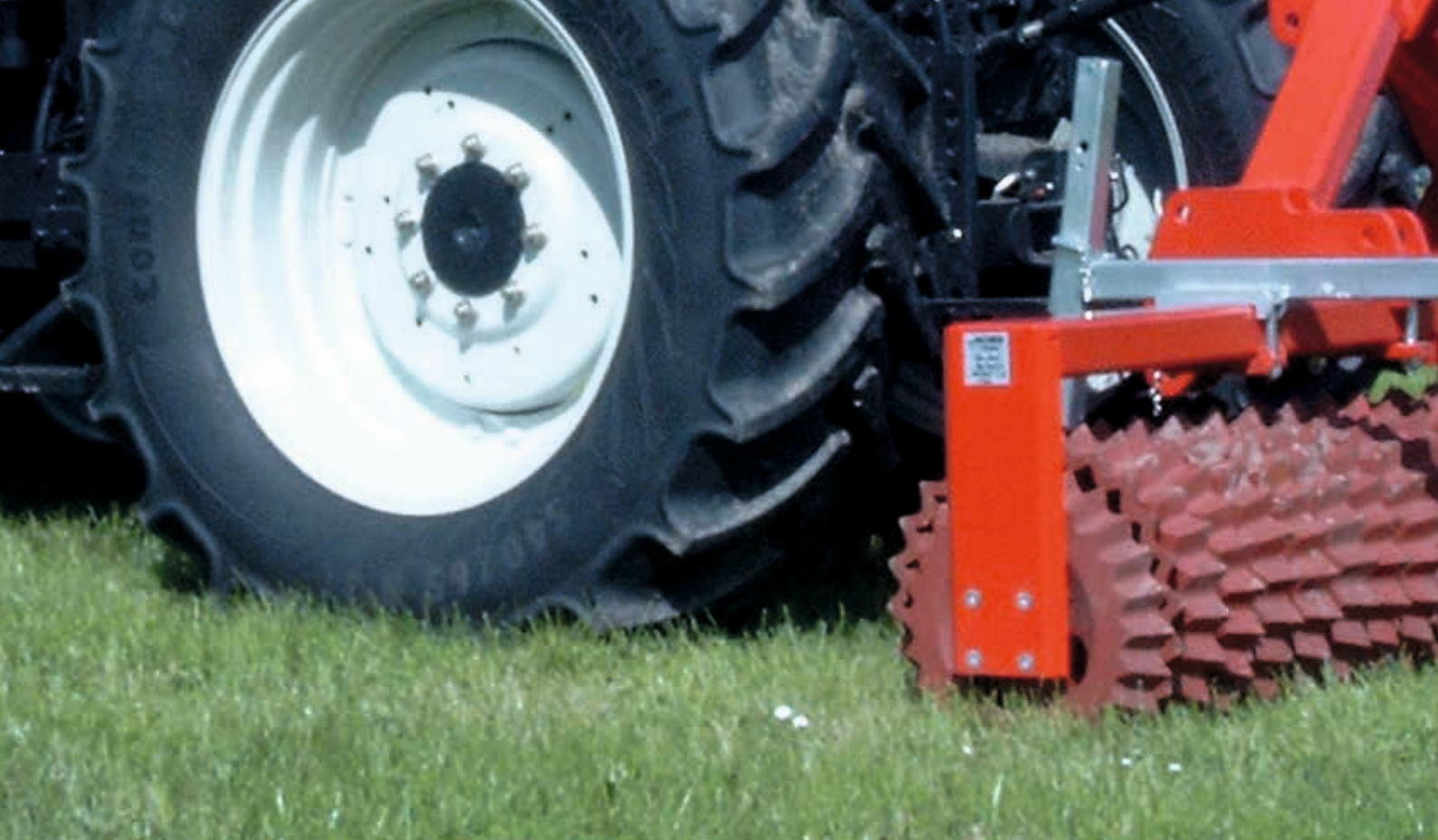
Matador 30 – starr von 1,5 bis 4 m. Das Multitalent für's ganze Jahr. Für Grünland und Acker.