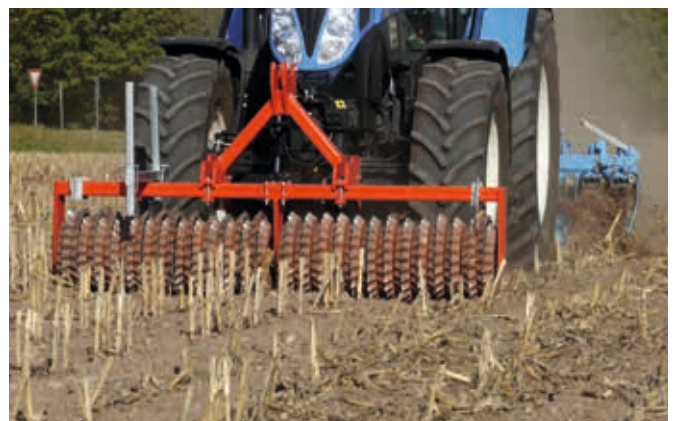
Effektive Bekämpfung des Maiszünslers mit enormer Schlagkraft und moderatem Spritverbrauch