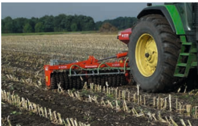
Effektive Bekämpfung des Maiszünslers mit enormer Schlagkraft und moderatem Spritverbrauch