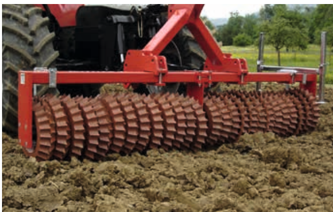
Matador 30 – Zur Saatbettbereitung in Front und Heck