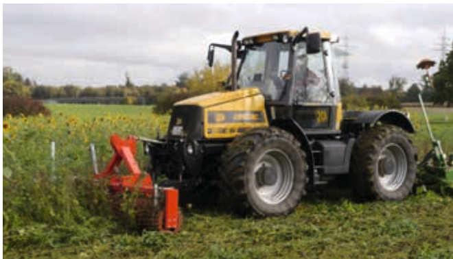
Umwalzen von Begrünungen vor der Bodenbearbeitung