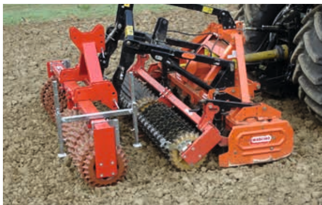
Matador 30 – Zur Saatbettbereitung mit Kreiselege