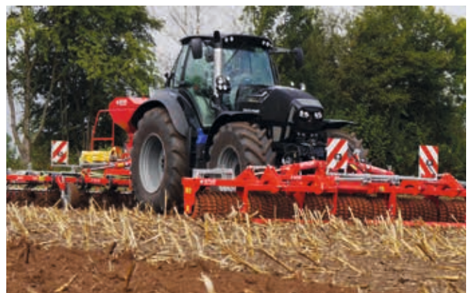
Maiszünslerbekämpfung und gleichzeitig Begrünung etablieren