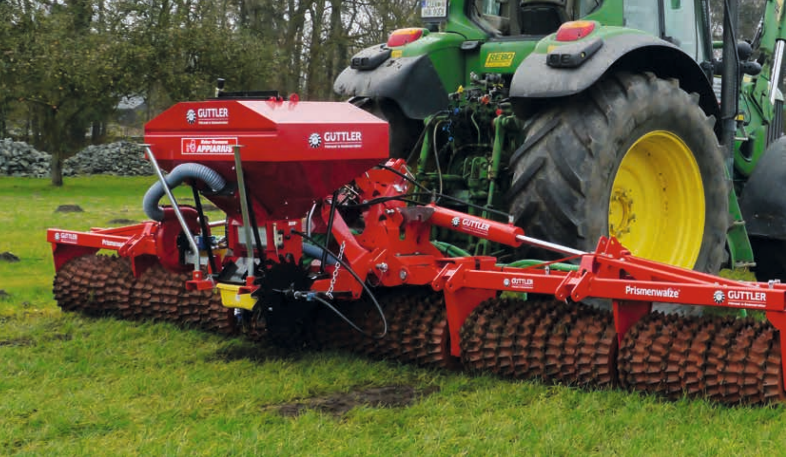
GreenMaster 600 Alpin mit Matador 610 – Genial auch auf Grünland: Bestockungsanregung, Bodenschluss für die Nachsaat, dichtere Graßnarben, höhere Erträge