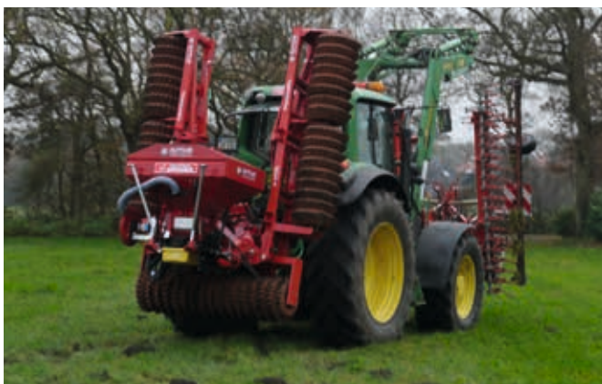
Matador 610 – Transportbreite 2,50 m