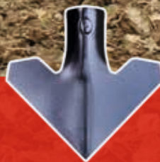
Gänsefußschare 200 mm

Von 3 - 12 Meter Arbeitsbreite, 5- und 7-balkig