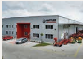
GÜTTLER® Hauptsitz, Kirchheim-Teck, Deutschland