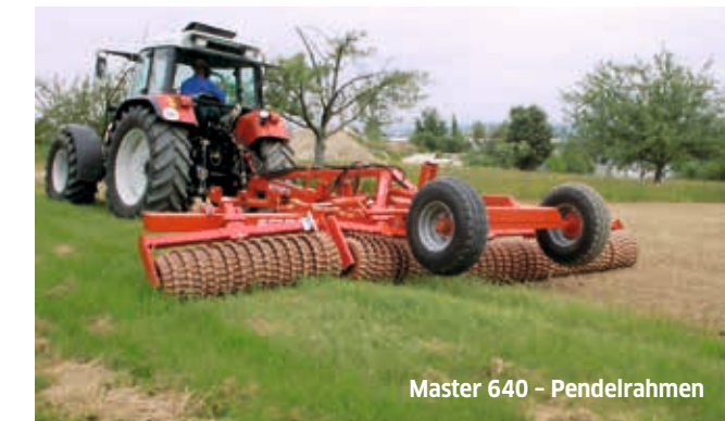
Master 640 – Pendelrahmen