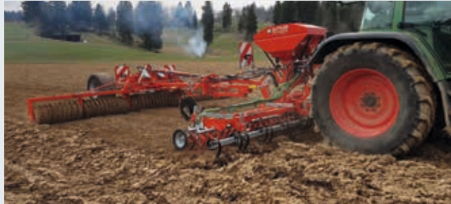
HarroFlex Striegel, auf Wunsch mit Sägerät