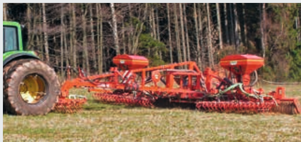
Ab 9,40 m auf Wunsch Non-Stop-Striegel und Sägeräte