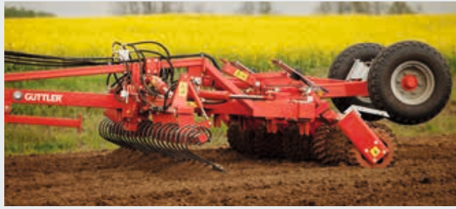
Master 640 mit FlatSpring