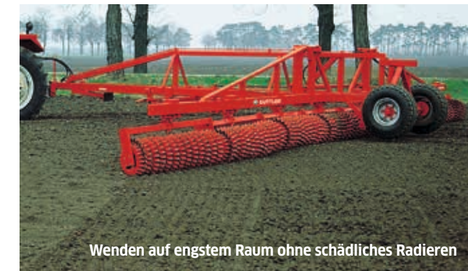
Wenden auf engstem Raum ohne schädliches Radieren