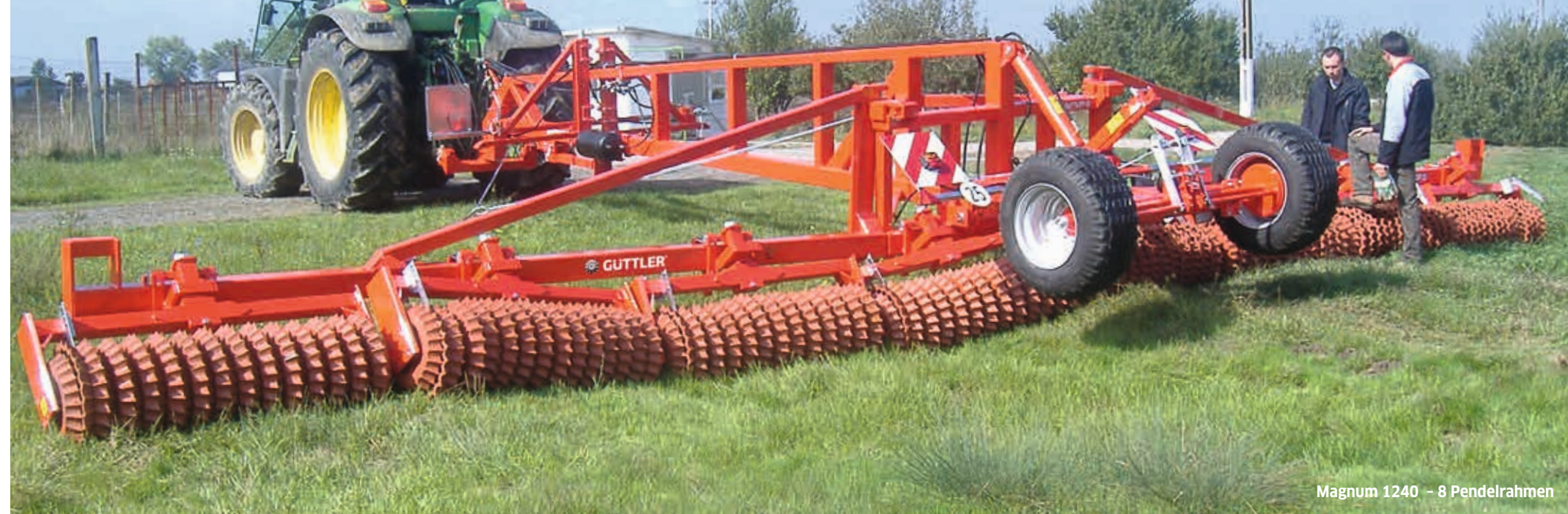
Magnum 1240 – 8 Pendelrahmen