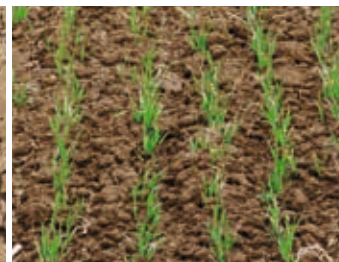
Derselbe Bestand Ende Februar