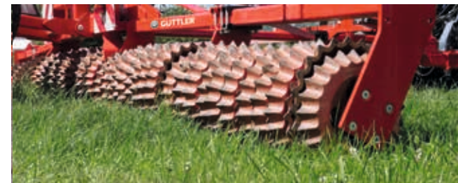
Auf Grünland: Blatt- und Knotenverletzungen regen die Bestockung stark an.