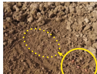
Im Oktober gewalzt Stabile Krümelstruktur