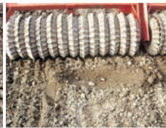
... sondern so Unten fest und fein - Oben locker krümelig