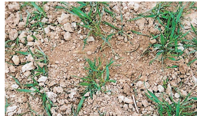
Wintersaaten im Frühjahr gewalzt: Bestockung anregen, Krusten brechen und Feuchtigkeit im Boden halten.