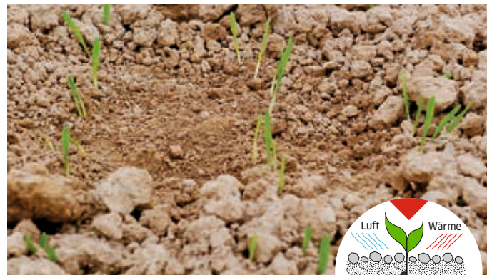
Wintergerste nach der Saat gewalzt Unten fest - oben locker, kein Verschlämmen

Höhere Gerätemasse = Gefahr der Bodenversiegelung, Sauerstoffmangel im Wurzelraum