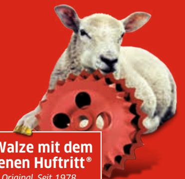
Die Walze mit dem goldenen Huftritt® Das Original. Seit 1978

Genau diesen Schaffuß-Effekt machen Sie sich mit der GÜTLER-Walze mit 305 Prismenspitzen pro Quadratmeter zu Nutzen!