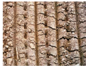
Nicht so ... Oben fest und fein - Verschlammungsgefahr!

Mit GÜTLER-Walzen erzielen Sie mit Sicherheit alle drei Faktoren in einem ideal ausgewogenen Verhältnis zueinander!