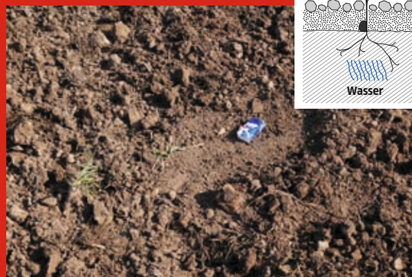
SuperMaxx® CULTI : Saatbett, unten fest – oben locker Feinerde unten (Sameneinbettung) Grobkrümel oben (Verschlammungsschutz)