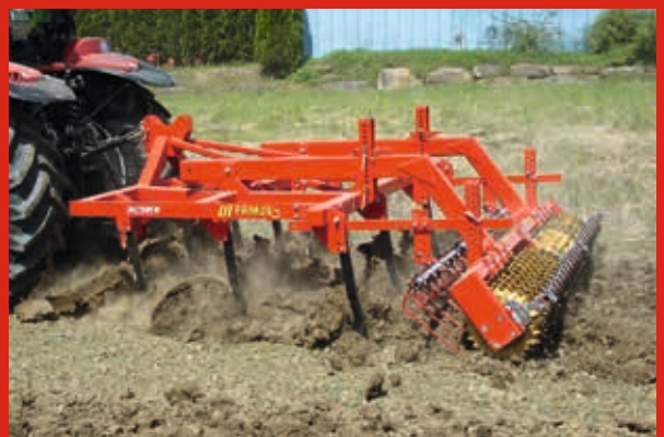
Kluten sind selbst gemacht! Weder wachsen sie im Boden, noch fallen sie vom Himmel!