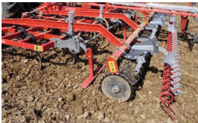
Option: Striegel nach der Walze zur mechanischen Unkrautbekämpfung.

Die Zinken des GÜTLER® SuperMaxx® lösen Unkräuter aus dem Boden und fördern sie an die Oberfläche. Die nachfolgende Walze wird sie jedoch wieder andrücken, so daß sie u.U. weiter wachsen. Zur Unkrautbekämpfung empfiehlt ich deshalb der Nachstriegel, der die Unkräuter zuverlässig an die Oberfläche fördert, wo sie vertrocknen. Bei der Bearbeitung werden gleichzeitig Unkrautsamen zum Keimen angeregt. Ein nochmaliger Durchgang einige Zeit später beseitigt auch die frisch gekeimten Unkräuter und bewirkt so eine regelrechte „Unkrautkur“.