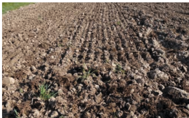
... mischt, krümelnd und ebnet das Saatbett perfekt ein.