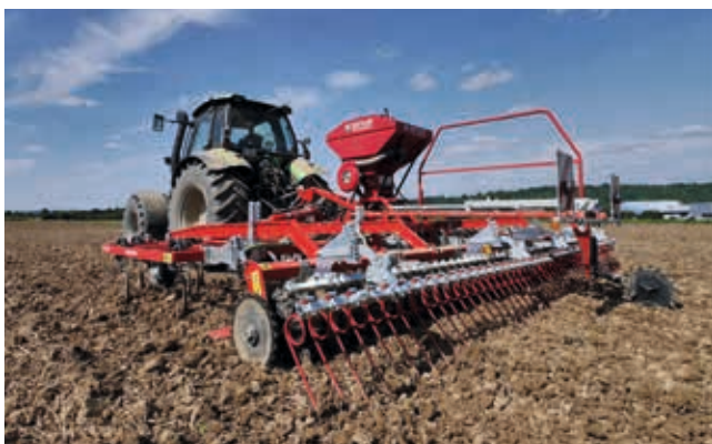
Mit Hilfe der optionalen Stützräder vorne lässt sich der Druck auf den RollFix bei feuchten Böden reduzieren. Bodenschonend!

Je trockener der Boden, desto stärker kann die Rückfestigung gewählt werden.