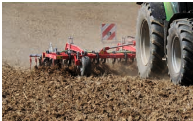
Zur Unkrautbekämpfung können Stützräder vorne hilfreich ein, um Druck von der RollFix-Walze zu nehmen.

Je nach Einstellung fangen sie mehr oder weniger Gerätegewicht ab, so daß die RollFix-Walze die von den Zinken gelösten Unkräuter nur leicht andrückt. Der Nachstriegel tut sich dann wesentlich leichter damit, die Unkräuter an der Oberfläche abzulegen. Je feuchter und bindiger der Boden bei der Bearbeitung ist, desto wertvoller werden die Stützräder. Im Extremfall übernehmen sie das Gerätegewicht zur Gänze, und die leichte RollFix-Walze rollt nur unter ihrem Eigengewicht ab.