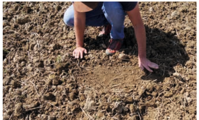
Ganzflächig durchgearbeitet mit Federzinken und Striegel – ein resultierender Strichabstand von nur 6,5 cm!