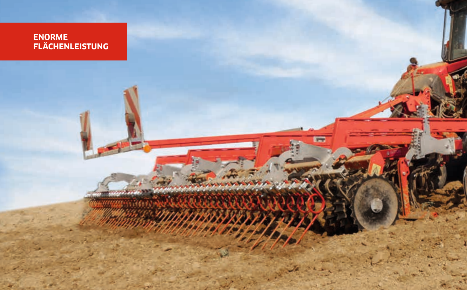
Super Maxx® 60-5 CULTI