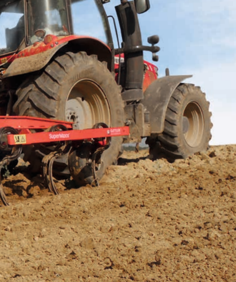
Option: Stützräder und Nachstriegel nach Walze