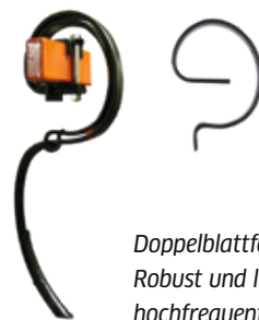
Doppelblattfederung: Robust und langlebig hochfrequent vibrierend