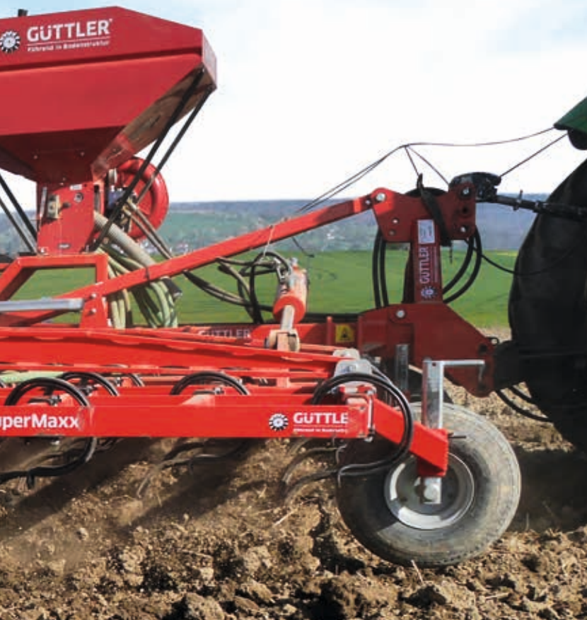
Option: Stützräder und Sägerät für Zwischenfrüchte