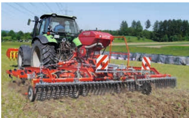
Die hochfrequent vibrierenden Zinken arbeiten in hartem Boden wie ein Presslufthammer.

Die Rahmen sind entsprechend robust gebaut, um diesen hohen Anforderungen gerecht zu werden.