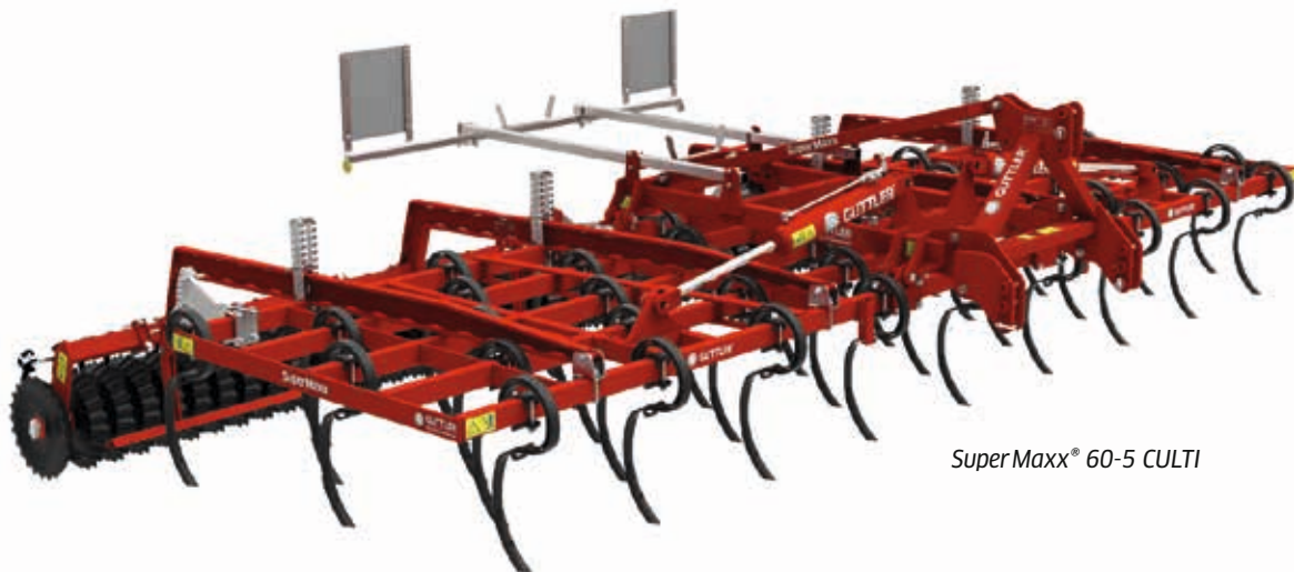
SuperMaxx® 60-5 CULTI