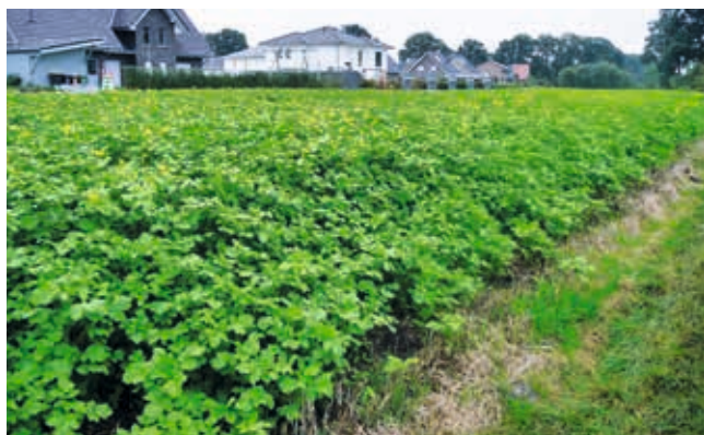
So gelingen Zwischenfrüchte ...