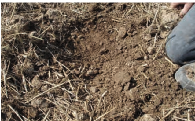
Nach dem zweiten Arbeitsgang: Vollständig durchgearbeitet, das Stroh ist angerottet, bricht und wird oberflächennah eingemischt.