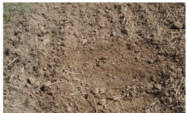
Ein feinkrümeliges, abgesetztes Saatbett, das Stroh ist weiter verrottet und eingemischt. Ein ideales Saatbett für Zwischenfrüchte!