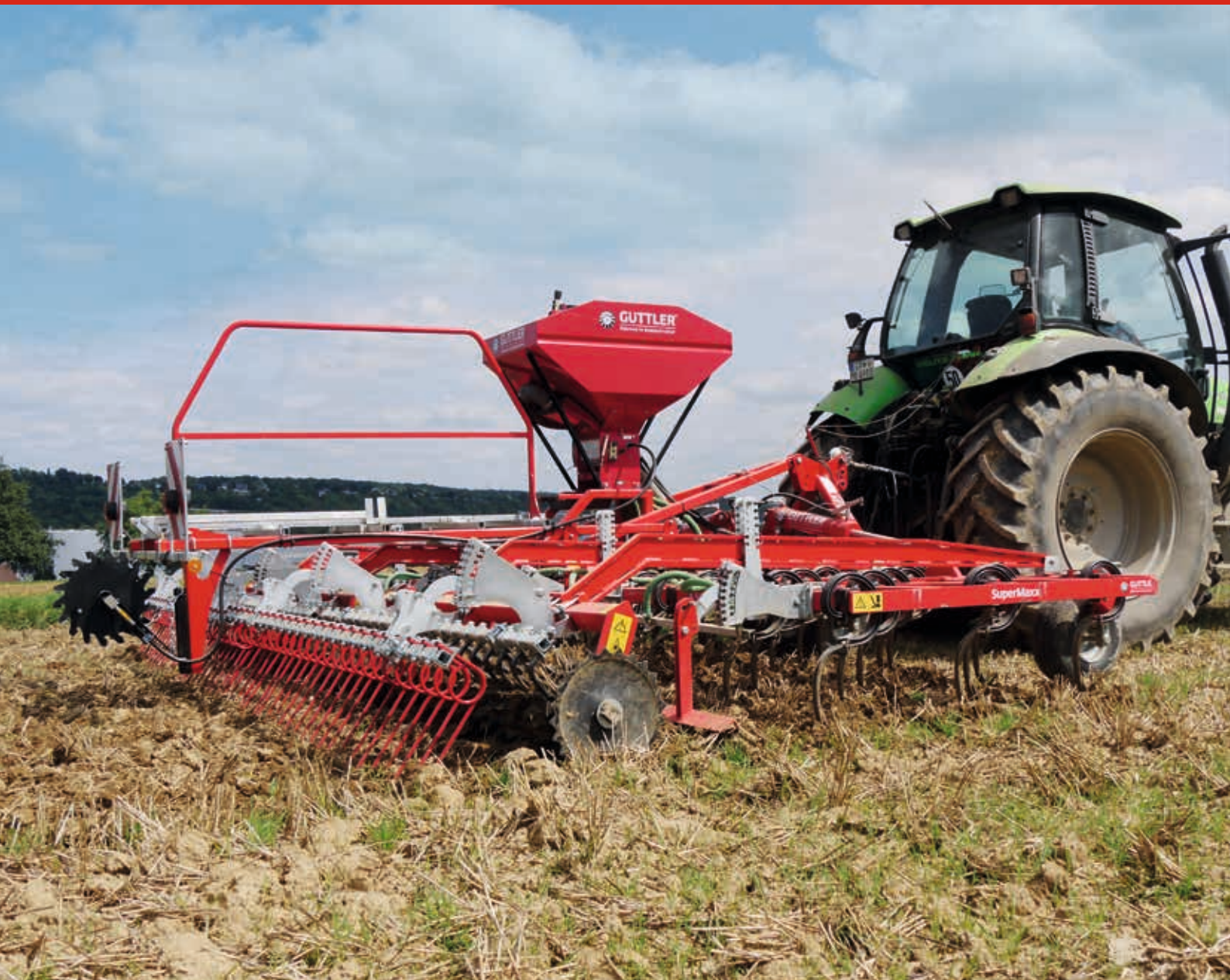
SuperMaxx ® 60-5 CULTI / Option: Stützräder Nachstriegel nach Walze und Sägerät für Zwischenfrüchte