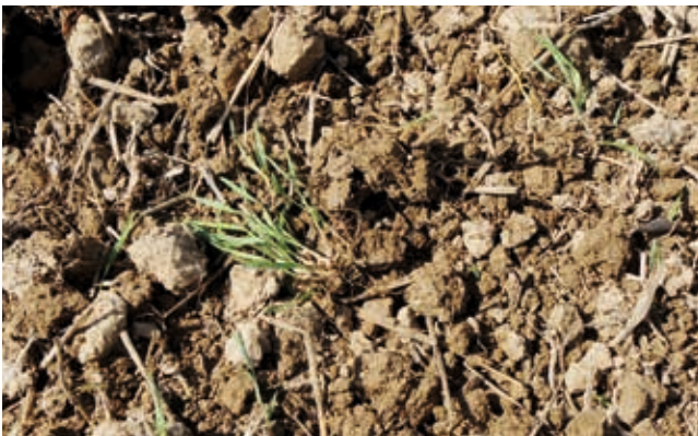
Der Nachstriegel legt die von den Federzinken gelösten Unkräuter lose an der Oberfläche ab, wo sie vertrocknen.

verriegelt werden, so daß sie auf derselben Arbeitstiefe laufen wie die Super Maxx®-Zinken. Man halbiert somit den Strichabstand auf 6,5 cm und erzielt ein vollständiges Durcharbeiten! Die hochfrequenten Schwingungen der Super Maxx®-Zinken sowie der Striegel-Zinken bewirken den Rest.