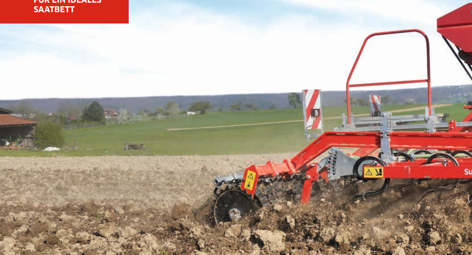
Super Maxx® 60-5 CULTI