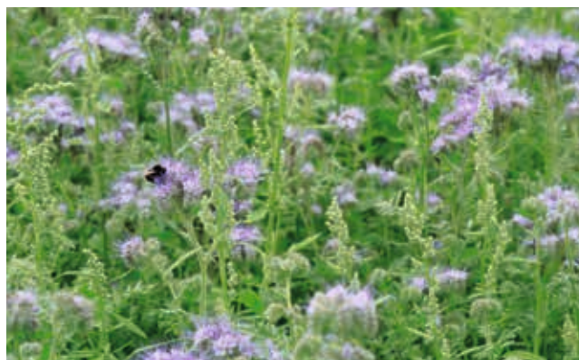
... auch als Gemenge.