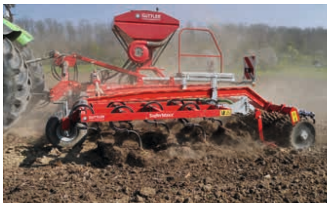
Die Planierplanke vor der Walze (Serie) ...

Vor der Walze sorgt eine Planierplanke für perfektes Einebnen. Sie ist leicht einzustellen und wenig verstopfungsanfällig. Zur Stoppelbearbeitung wird sie mit einem Handgriff außer Dienst gestellt.