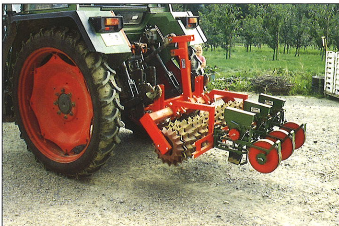
Geräteschiene für Sembdner-Sägeräte

während Grobkümel nach oben gebracht werden = bester Verschlammungsschutz