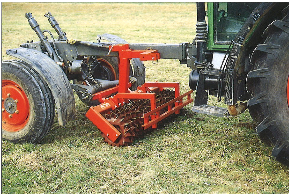
Mehrfach-Dreipunkturm für Front-, Heck- und Zwischenachsnaubau