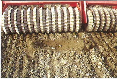
Optimale Rückfestigung - ideale Struktur