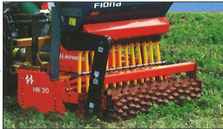
... auch an Kreiseleggen oder Fräsen.