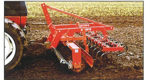
... auch mit Zinkenvorsatz.