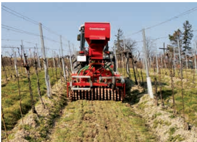
Der Grubber unterfährt den Bestand ohne zu mischen. Der Boden bleibt bedeckt: Wassersparend, Erosionsschutz.