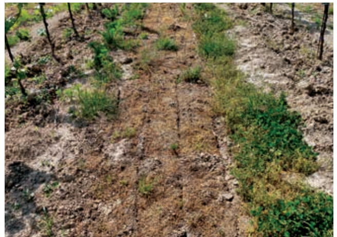
Die unterschrittene Pflanzendecke stirbt ab und schützt den Boden vor Sonneneinstrahlung, Austrocknen und Erosion.