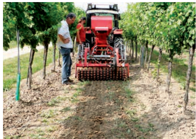
Ansaat von Blühstreifen in offenen Fahrgassen. Flaches wassersparendes Bearbeiten.