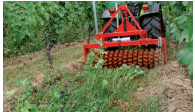
Niedrige Intensitätsstufe: Wachstum hemmen durch walzen.