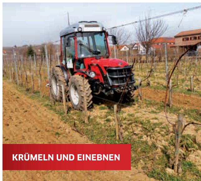
KRÜMELN UND EINEBENEN