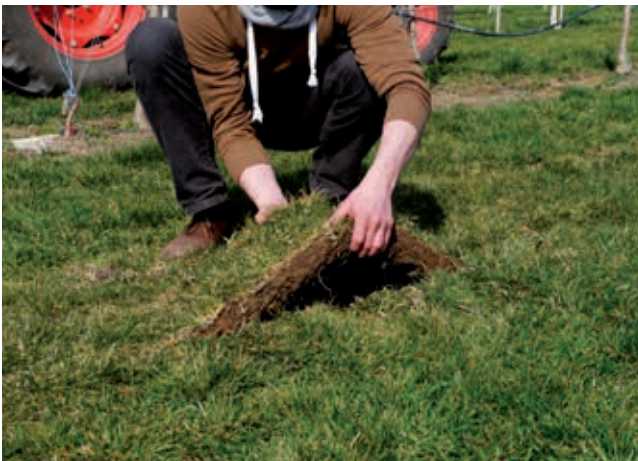
Höchste Intensitätsstufe: Wachstum stoppen durch Unterschneiden. Sollte es danach ausgiebig regnen, kann sich die Begrünung regenerieren und weiter wachsen. Sie können nichts falsch machen.