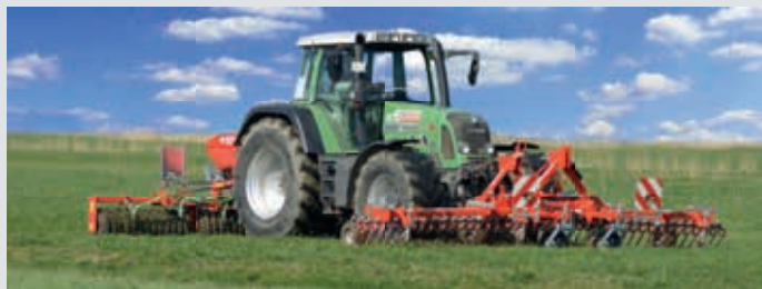
Striegeln, säen und walzen in einem Arbeitsgang