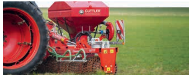
Pneumatisches Sägerät Es verteilt das Saatgut exakt und bodennah.