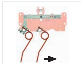
Einfache, zentrale Verstellung der Zinken: Mit wenigen Handgriffen verstellen Sie den kompletten Striegel.