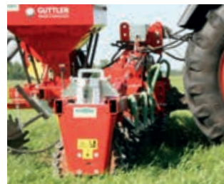
... sorgt für eine hohe Bestockung, tragfähigere Grasnarben und höhere Erträge!