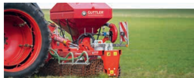
Pneumatisches Sägerät Es verteilt das Saatgut exakt und bodennah.