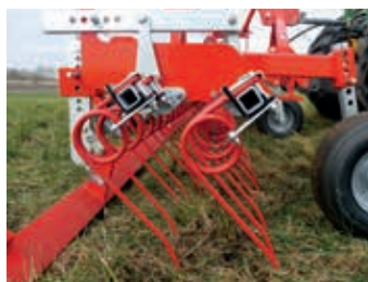
... und Einebnungsschiene

2 Schnell verstellbar von sanft bis aggressiv