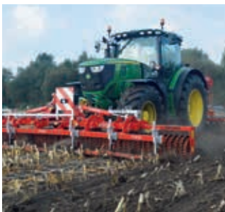
Zur Maiszünslerbekämpfung mit kombinierter Bodenbearbeitung