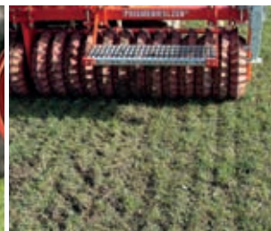
... bringt die Nachsaat sicher an den Boden und sorgt für den nötigen Bodenschluss.