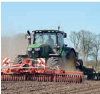
Als Frontpacker zur Aussaat