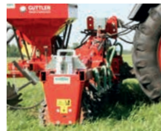
... sorgt für eine hohe Bestockung, tragfähigere Grasnarben und höhere Erträge!