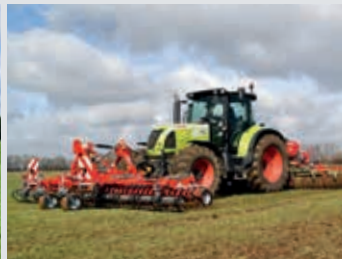
3 Meter Arbeitsbreite