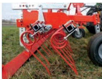
... und Einebnungsschiene

2 Schnell verstellbar von sanft bis aggressiv