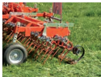
Optional wählbar zwischen Ripperboard ...

1 Der kürzeste vierbalkige Striegel am Markt (mit Ripperboard)