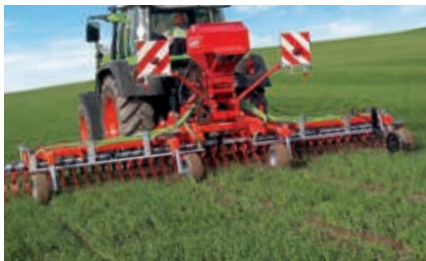
GreenSeeder 600: Untersaaten von Gras in Triticale.