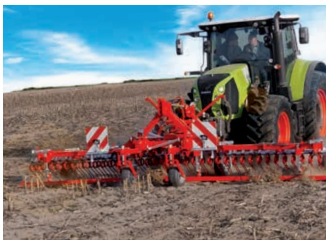
HarroFlex 600 lässt sich bei Bedarf auch im Frontanbau (ohne Sägerät) fahren. Kombiniert mit einer Matador-Walze wird er zu Greenmaster 600 alpin – eine schlagkräftige 5-in-1 Maschine für den Ganzjahreseinsatz.