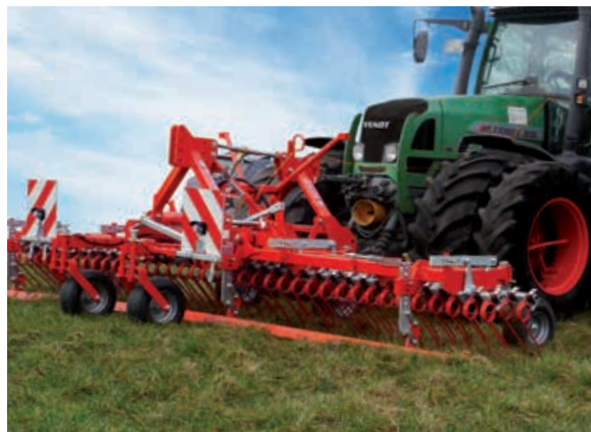
Jeder HarroFlex-Striegel lässt sich wahlweise in Front oder Heck betreiben.

Übrigens: Das Baukastensystem von GÜTTLER ist einzigartig. Und die Voraussetzung für unsere vielseitigen und sehr beliebten Grünland-Kombis.