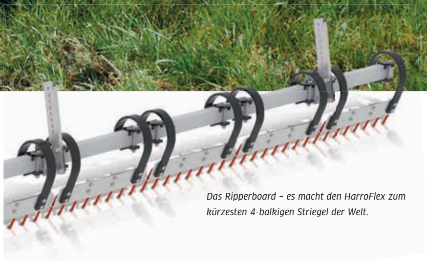
Das Ripperboard – es macht den HarroFlex zum kürzesten 4-balkigen Striegel der Welt.

FLEXIBLES BAUKASTENSYSTEM Einebnungsschiene oder Ripperboard? Das entscheiden Sie. Das Ripperboard verdoppelt die Vertikutierwirkung. Feinfühlig einstellbar von „null“ bis „maximal“. Es eignet