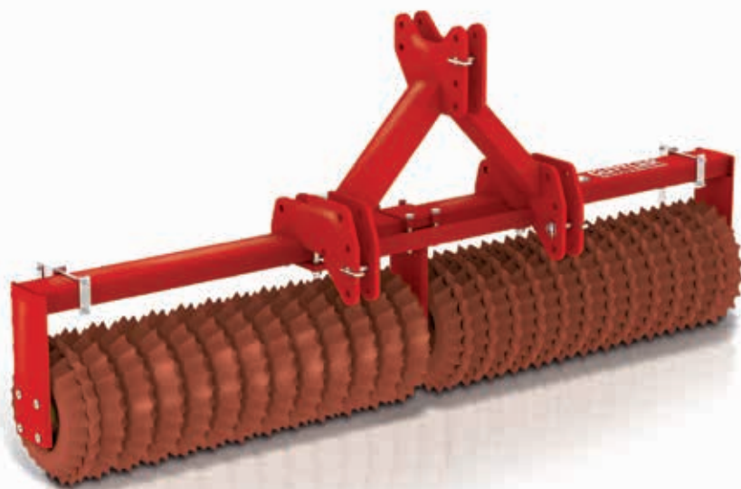
Matador, Master, Mayor - GÜTTLER bietet Ihnen für jeden Anwendungsbereich die passende Walze. In unterschiedlichen Maßen und Ausführungen.

Und der HarroFlex-Striegel von GÜTTLER? Er ist der kompakteste und vielseitigste Striegel am Markt. Und der erste, der die Gemeine Rispe wirklich anpackt. Warum? Weil er mit wenigen hochrobusten Zinken enorm effektiv entfilzt und lüftet. Seine Striegelzinken sind mit 12 mm Stärke 3-fach so steif wie die 8 mm Zinken herkömmlicher Striegel. Der große Zinkenabstand sorgt für guten Durchlass ohne zu verstopfen. Und für die kompakte Bauweise. Voraussetzung für die beliebten Walzen-Striegel-Kombinationen von GÜTTLER.