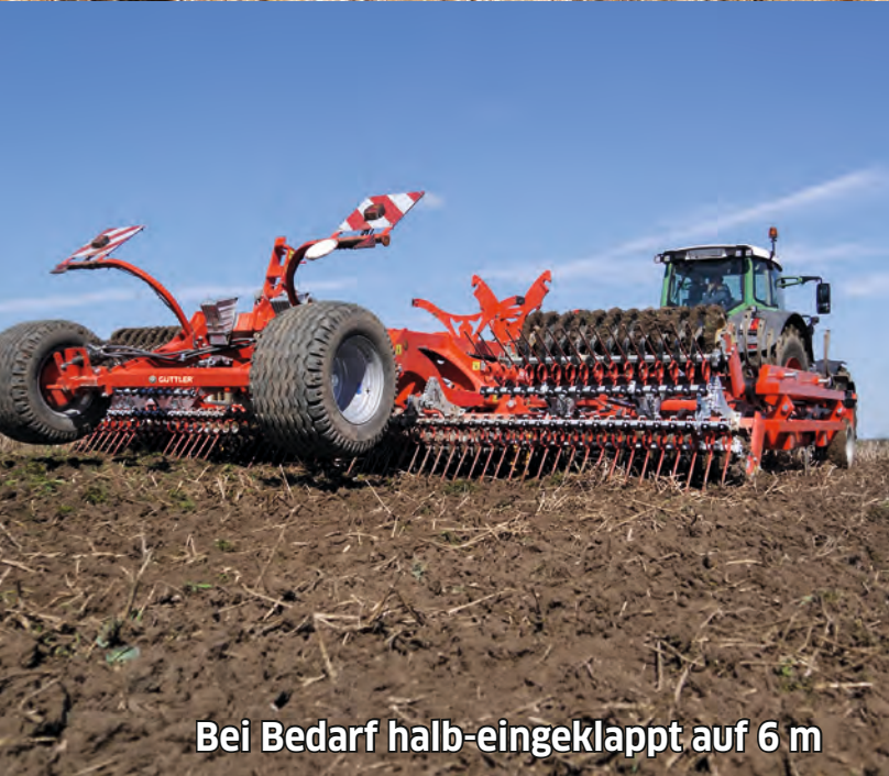
Bei Bedarf halb-eingeklappt auf 6 m