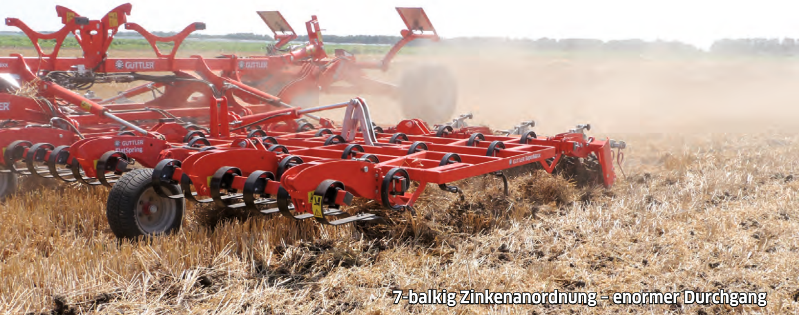
7-balkig Zinkenordnung – enormer Durchgang