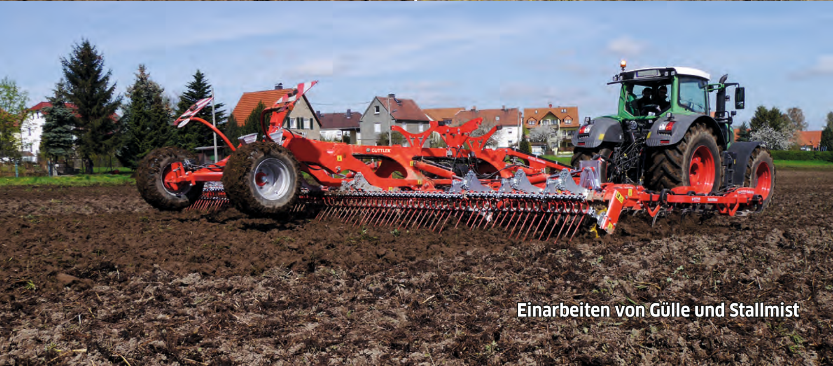
Einarbeiten von Gülle und Stallmist