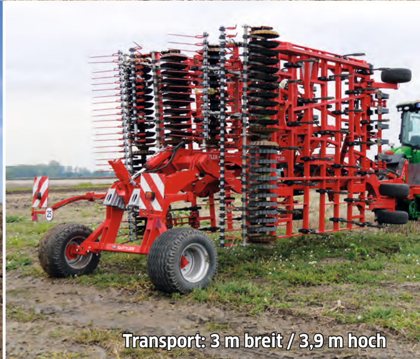
Transport: 3 m breit / 3,9 m hoch