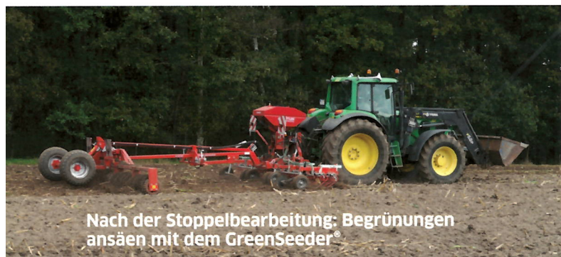
Nach der Stoppelbearbeitung: Begrünungen ansäen mit dem GreenSeeder®