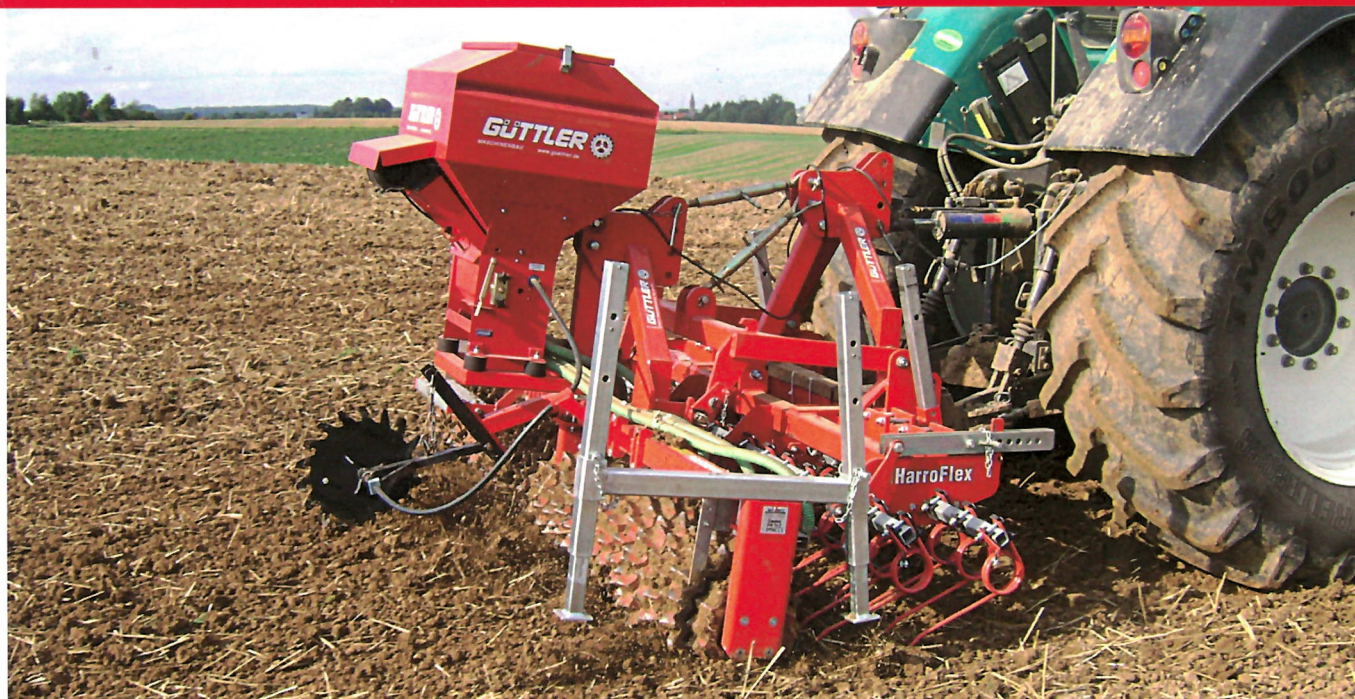
GreenMaster®: mit hoher Schlagkraft – so gelingen Zwischenfrüchte