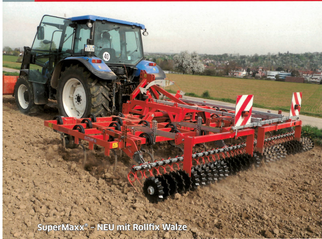
SuperMaxx® – NEU mit Rollfix Walze